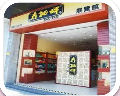
參觀壽桃牌專門店